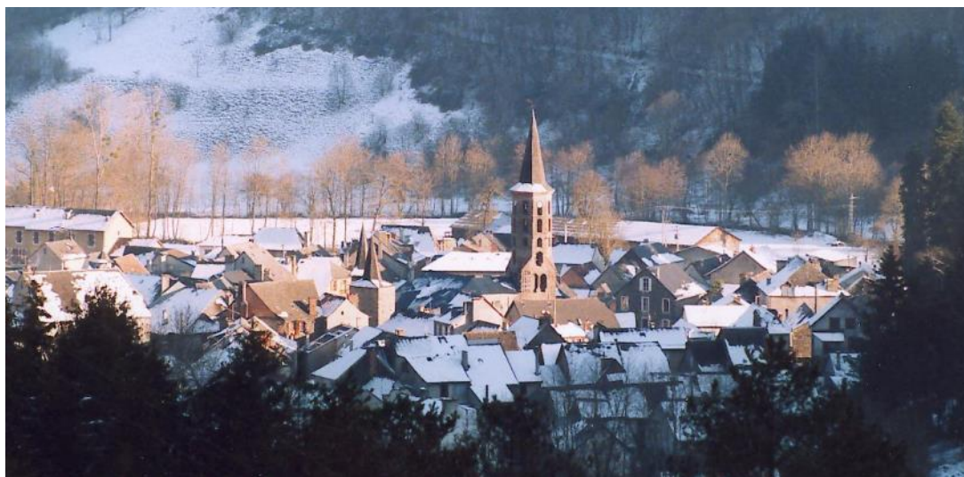
Sentein et son église fortifiée au creux de l'hiver